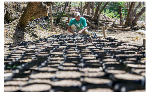
Eine der Baumschulen des Projektes für den Anbau von Tausenden von Setzlingen.