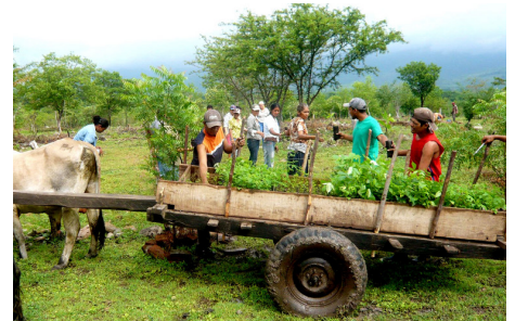
Laden des Anhängers mit Setzlingen: Während den Regenzeiten kommen ganze Dörfer zusammen, um unzählige Bäume zu pflanzen.